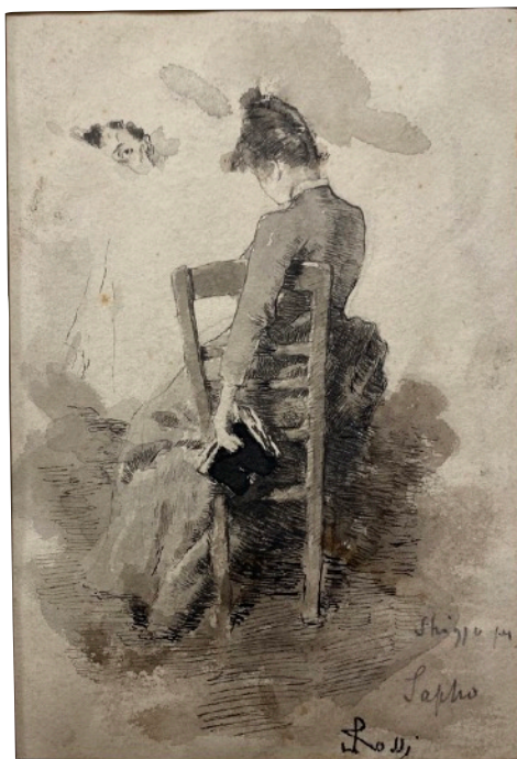
Luigi ROSSI Sappho assise