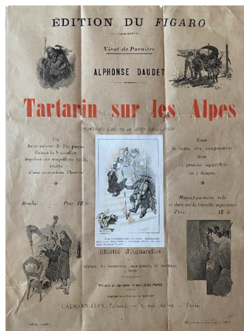
Affiche publicitaire pour la sortie de Tartarin sur les Alpes

Un an plus tard sort Tartarin sur les Alpes , en partie illustré par Rossi, qui se vend en quelques jours à près de 140 000 exemplaires, devenant ainsi l'un des romans les plus vendus du XIX e siècle.