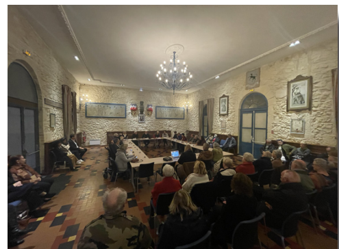
La salle était comble pour le conseil municipal du 23 novembre 2022